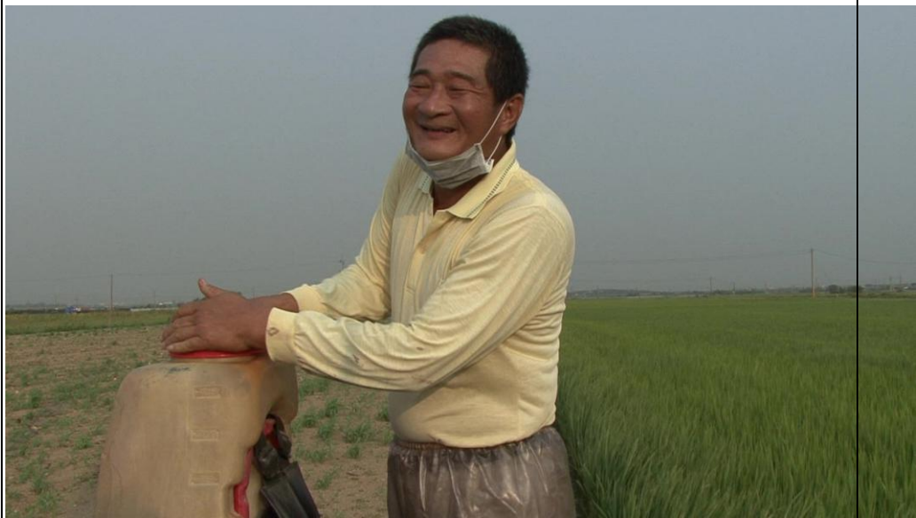
劇照 3-5 張